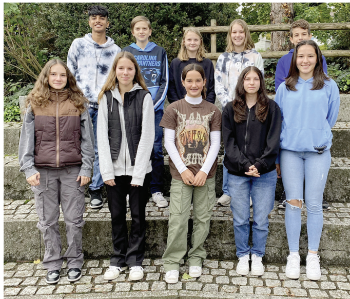
Das neue Schülerparlament

Vor den Herbstferien wurden die Parlamentarier:innen gewählt, die ihre Klasse im aktuellen Schuljahr im Schülerparlament vertreten.