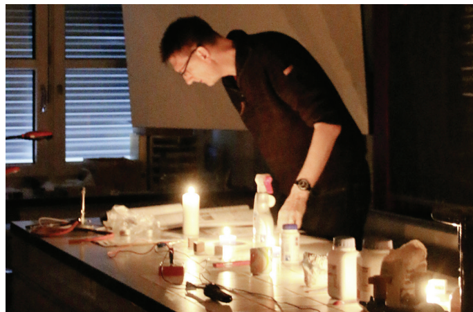
Unterrichtsmaterial entziffern – eine Herausforderung

Alle Bilder auf dieser Seite © Sek Stadel