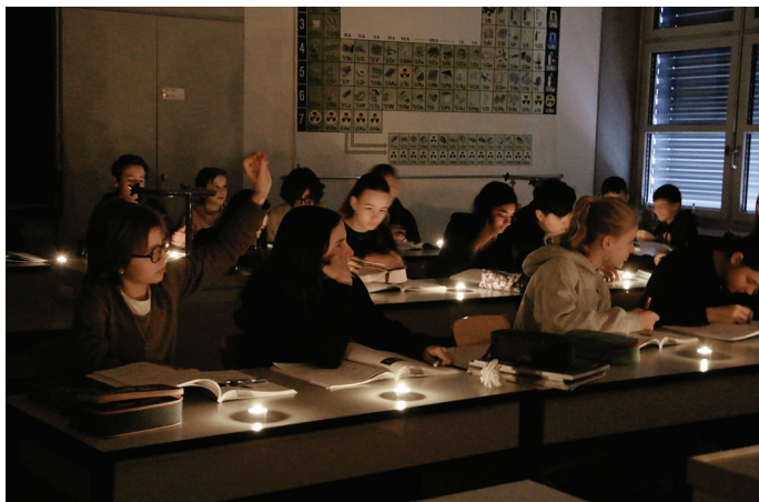
Freudige, konzentrierte Stimmung

Ob Chemie- oder Mathematikstunde: Energie und unsere Abhängigkeit vom Strom waren an diesem Morgen in jeder Klasse das Hauptgesprächsthema. Durchleuchtet wurden,