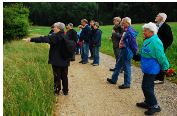
Exkursion Feuchtgebiete Mulflen