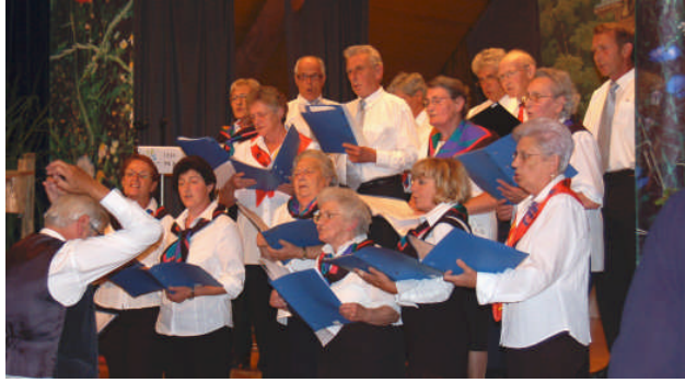
75 Jahre NVB Gemischter Chor Bachs-Oberhasli