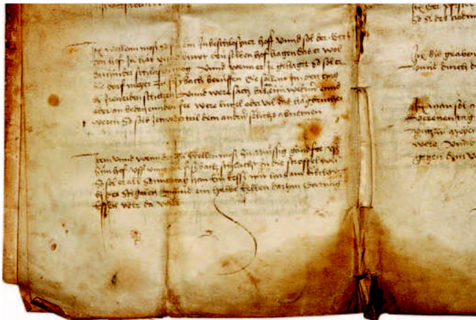
Auszug aus der Bachser Offnung

Im letzten Mitteilungsblatt hat der Gemeinderat zu einem Fest am 4. Dezember 2009 eingeladen. Der Anlass dafür ist die Bachser Offnung aus 1509. Damit wurden der Gemeindebann bzw. die Grenzen des Gerichtskreises und die gewohnheitsrechtlichen Regelungen festgelegt. Beispielsweise wurde der Besitzer des Hofes Wellenmoos (letztmals im 16. Jahrhundert erwähnt) verpflichtet, seinen Hof „derart solid einzuzäunen, dass er hinter dem Zaun ruhig schlafen könne“.