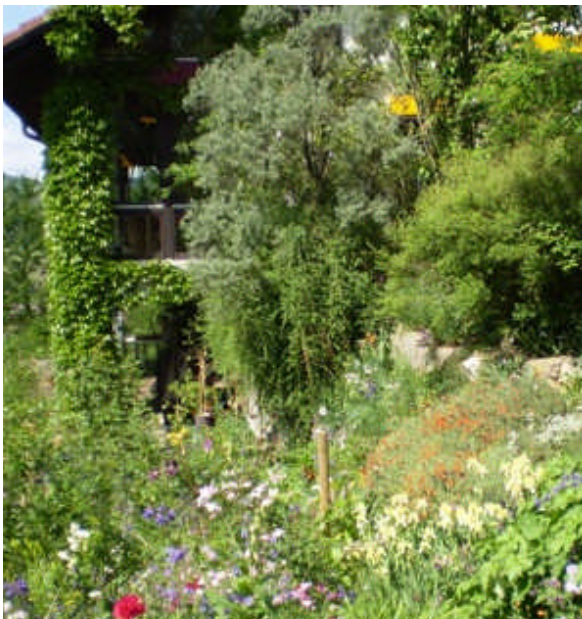
Elemente Wasser, Kletterpflanze und Totholz

Naturnahes Gärtnern legt spezielles Augenmerk bei Anlegung und Pflege darauf, dass der Gedanke des Umwelt- und Naturschutzes stärker berücksichtigt wird als im herkömmlichen Garten.