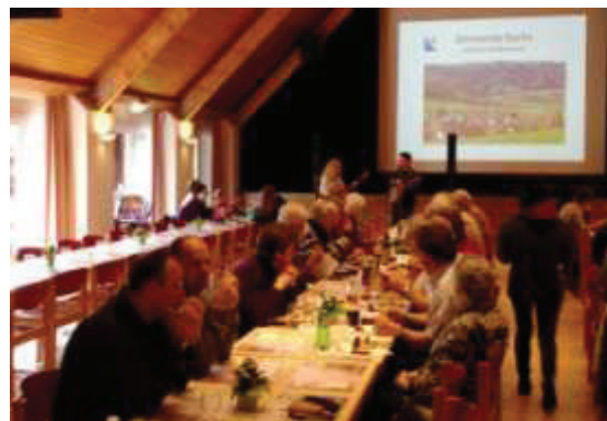
Gemütliche Klänge des Duo MoonRise