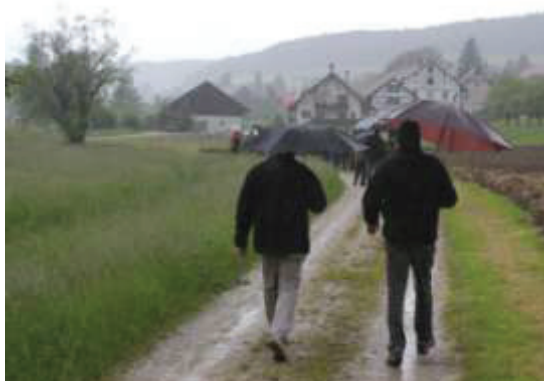
Dem Fisibach entlang