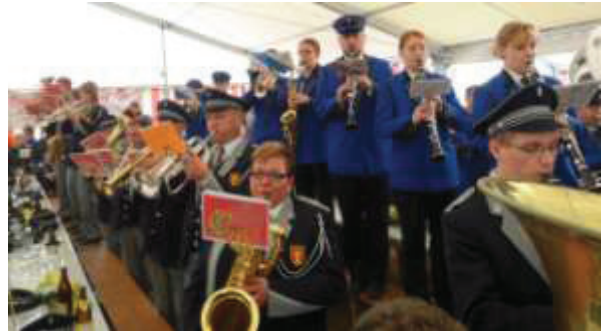
Gesamtchor im Festzelt in Eglisau

Geschätzte Einwohnerinnen und Einwohner von Bachs