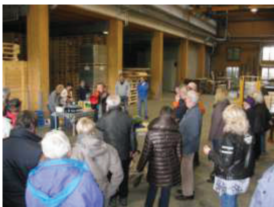
Die Sägerei Wirth offeriert einen vom Bachser Markt zusammengestellten, tollen Apéro.