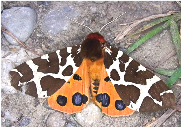
Brauner Bär

Einladung zur Nachtfalter - Exkursion am Samstag, 5.Juni 2021 Verschiebedatum: Samstag, 12.Juni 2021