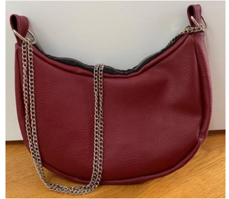
Blerta - Handtasche aus Kunstleder