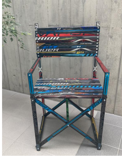
Dario - Recyclingstuhl aus Hockeystöcken