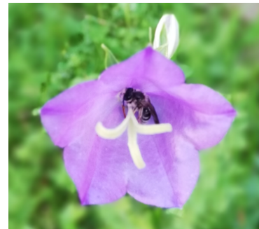
Sandbiene übermachtet in Glockenblume

Aktion für Einwohner von Bachs, Fisibach und Kaiserstuhl: Für Neophyten und gebietsfremde Pflanzen, die keinen Nutzen zur Förderung der Biodiversität haben und deshalb ersetzt werden, können einheimische Sträucher gratis bezogen werden. Beispiele für invasive Neophyten oder gebietsfremde Pflanzen sind: Kirschlorbeer, Tessiner Palme (chinesische Hanfpalme), Tuja, Sommerlieder u.a. Zu dieser Aktion ist eine vorgängige Kontaktaufnahme oder Besprechung vor Ort hilfreich.