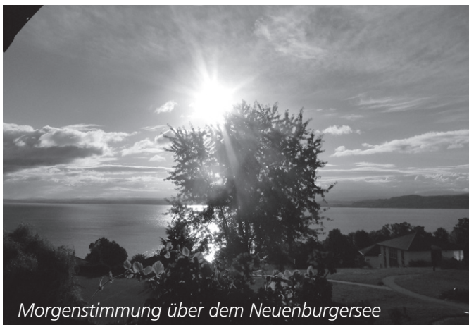
Morgenstimmung über dem Neuenburgersee

OBERSTUFENSCHULE STADEL Lehrpersonen und Schulpflege