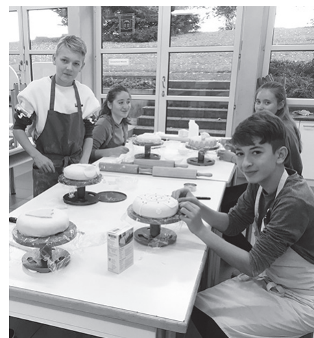
Unsere Schülerinnen und Schüler beim Bühnenbau und beim Verzieren von Torten