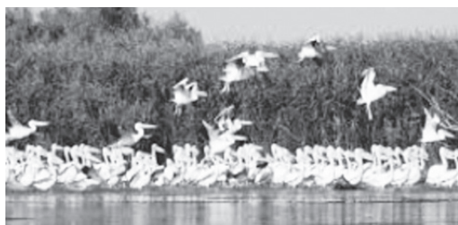
Pelikane, Donaudelta (Rumänien)