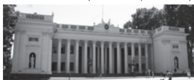
Rathaus Odessa (Ukraine)