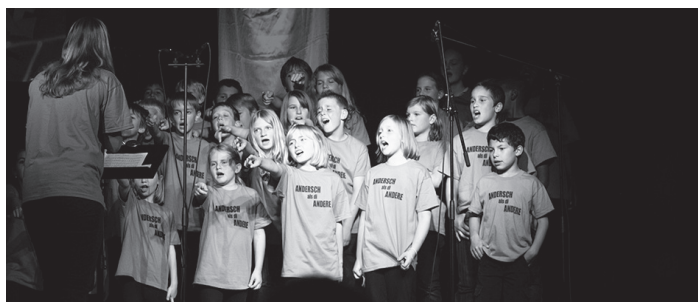
Musical mit Stadler Kindern, 2010