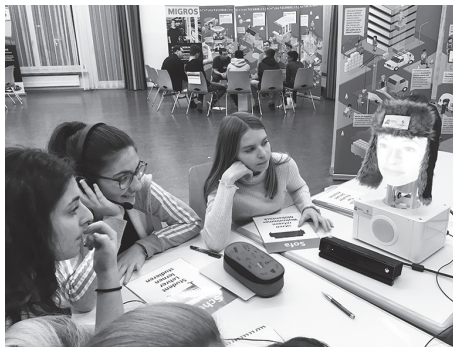
Tabu spielen mit SoEren, dem sprechenden Computer