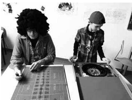
„Les Jeux sont faits“