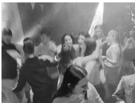
„Old School“ hielt auch in der Disco Einzug ...