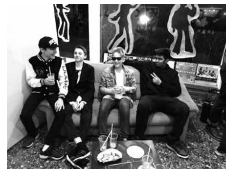
... und in der Lounge mit Musik ab Schallplatten.