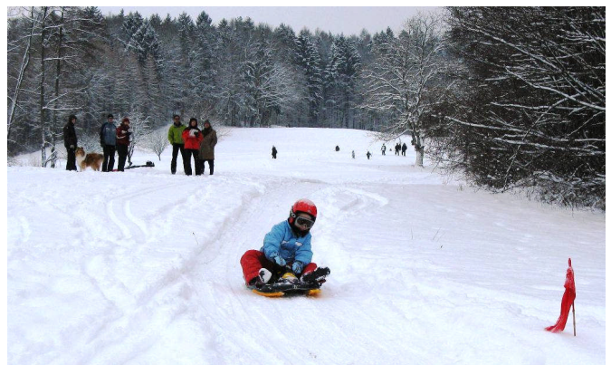
Die Siegerin in voller Fahrt!