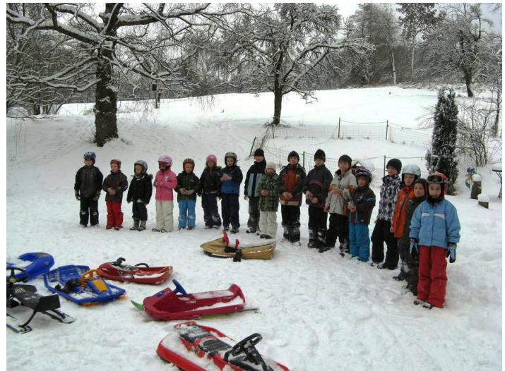
17 SchlittlerInnen erwarten gespannt ihre Preise