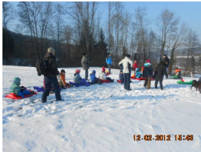
Vor dem Start

Bereits zur Tradition gehört das Schlittelfahren in der Stampfi. Dieses Jahr wurden alle Erwartungen übertroffen .