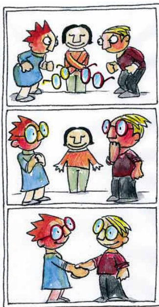
Aha-Effekt: Den Konflikt mit den Augen des anderen sehen

In diesem Mitteilungsblatt finden Sie die Unterlagen für die Anmeldung in die Grundstufe. Dabei gilt es zu bedenken, dass die individuelle Reife wesentlich zur erfolgreichen Einschulung ihres Kindes beiträgt. Früher ist nicht immer besser! Tendenzen wie frühkindliche Bildung, Frühlernprogramme und ein damit verbundener einseitiger Leistungsdruck vor der Einschulung aufzubauen, sind immer häufiger erkennbar. Untersuchungen in Europa zeigen, dass dies einer harmonischen Entwicklung der Kinder eher abträglich ist. „ Früher rein und früher raus! “ oder „ Später rein und später raus! “ Ist hier nicht die Frage. Es geht um das Wohl des einzelnen Kindes. Stichtage sind wage Orientierungshilfen. Ich denke, es liegt an uns Erziehenden in diesem Fall, den richtigen Zeitpunkt zu bestimmen und zum Wohle des Kindes zu entscheiden. (hul)