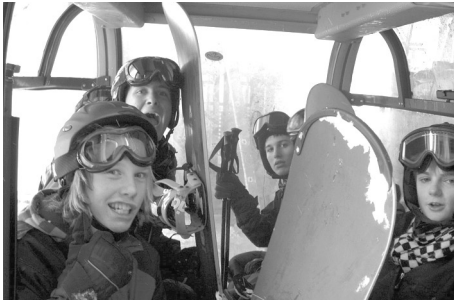
In der Gondelbahn zur Rinderhütte

Um acht Uhr startete die Fahrt nach Leukerbad. Mit den singenden und aufgestellten Schülern ging die Fahrt schnell vorüber. In Leukerbad, mit freudigen Gesichtern angekommen, mussten wir erstmals das viele Gepäck zur Gondel tragen, mit welcher wir anschliessend in unsere Unterkunft, die Rinderhütte, hinauffuhren.