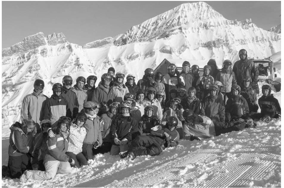
Gruppenfoto mit 41 Schülern und 7 Leitern; alle mit Helm!