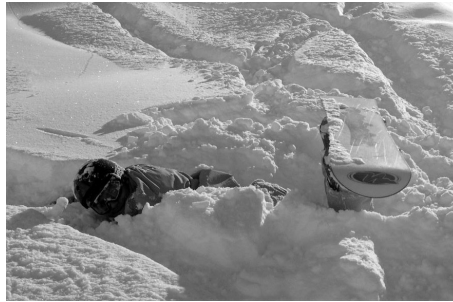
Bei wunderschönem Pulverschnee am Rand der Piste; da macht sogar das Stürzen Spass!