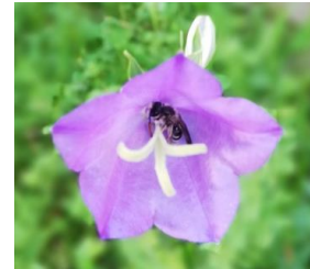
Sandbiene übernachtet in

Aktion für Einwohner von Bachs, Fisibach und Kaiserstuhl: Für Neophyten und gebietsfremde Pflanzen, die keinen Nutzen zur Förderung der Biodiversität haben und deshalb ersetzt werden, können einheimische Sträucher gratis bezogen werden. Beispiele für invasive Neophyten oder gebietsfremde Pflanzen sind: Kirschlorbeer, Tessiner Palme (chinesische Hanfpalme), Thuja, Sommerflieder u.a. Zu dieser Aktion ist eine vorgängige Kontaktaufnahme oder Besprechung vor Ort hilfreich.