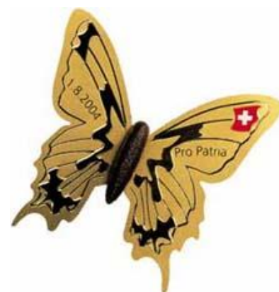
1. August-Abzeichen 2004

Wir singen: - schön ischs Bachsertal - Aened am Wehntal