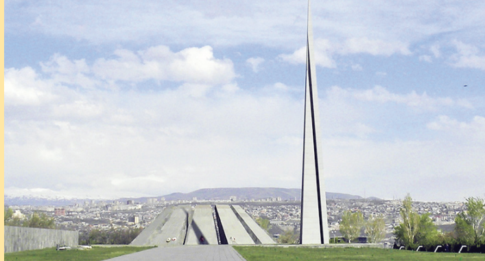
Genozid Denkmal in Jerewan