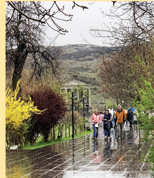
Sonnentempel von Garni im Regen