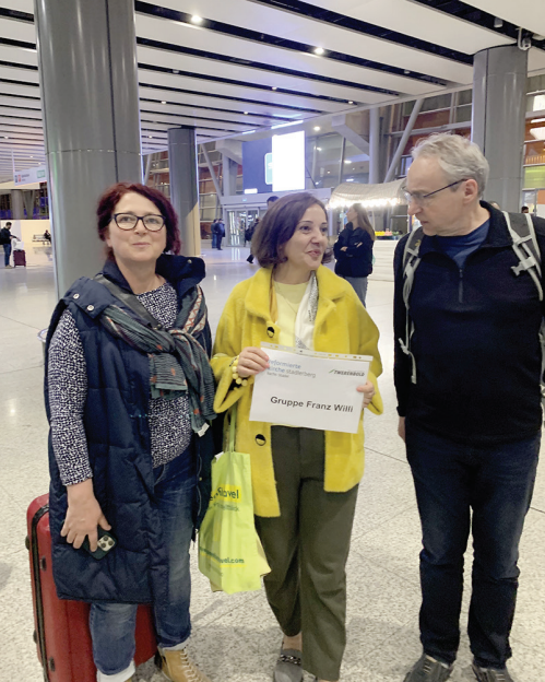
Begrüßung am Flughafen Jerewan