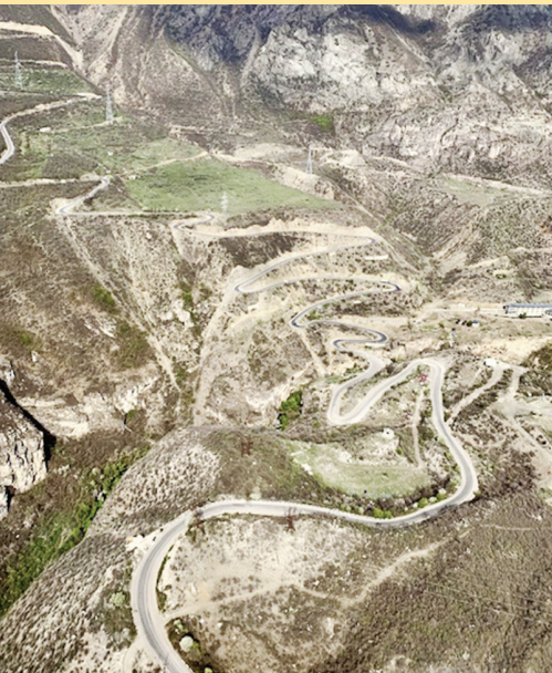
Blick aus der Seilbahn zum Kloster Tatev