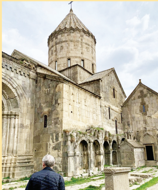
Kloster Tatev - mit der Seilbahn erreicht