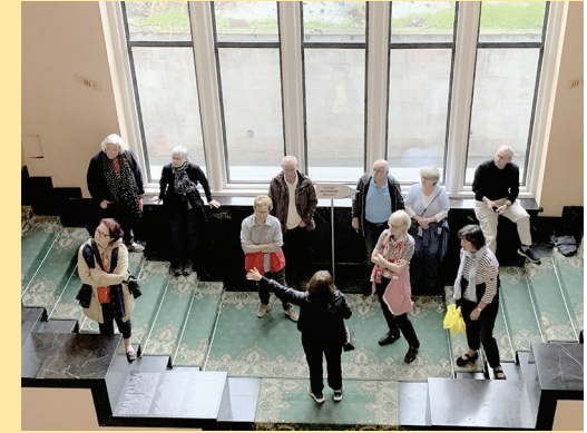
Führung im Schriftenmuseum