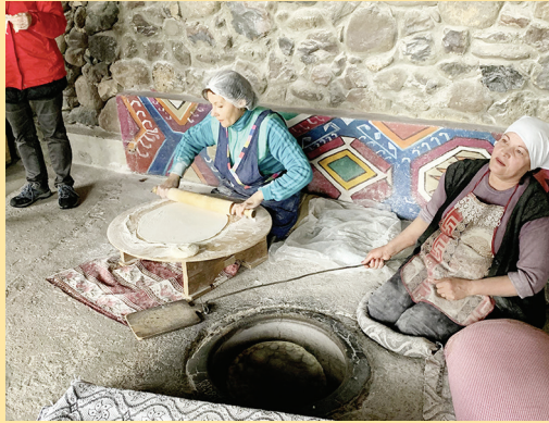
Brotbacken auf Armenisch