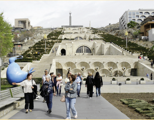
vor den Kaskaden in Jerewan