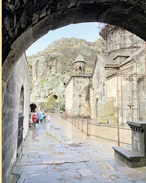
Am Felsenkloster Geghard