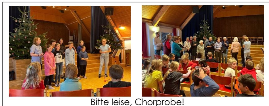
Bitte leise, Chorprobe!

Wir wünschen allen Leserinnen und Lesern einen geschmeidigen Rutsch und einen guten Start ins neue Jahr. Wir freuen uns, wenn wir Ihnen über die zweite Hälfte unseres Schuljahres wieder berichten dürfen.