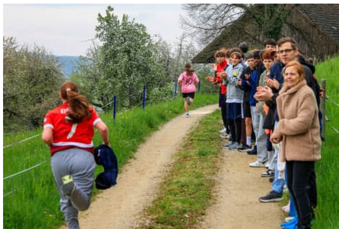
Beim Zieleinlauf werden die Mädchen nochmals von ihren Mitschülern und Lehrpersonen angefeuert.