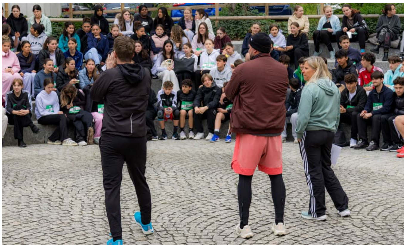
Versammlung und letzte Informationen vor dem Lauf in der Arena.